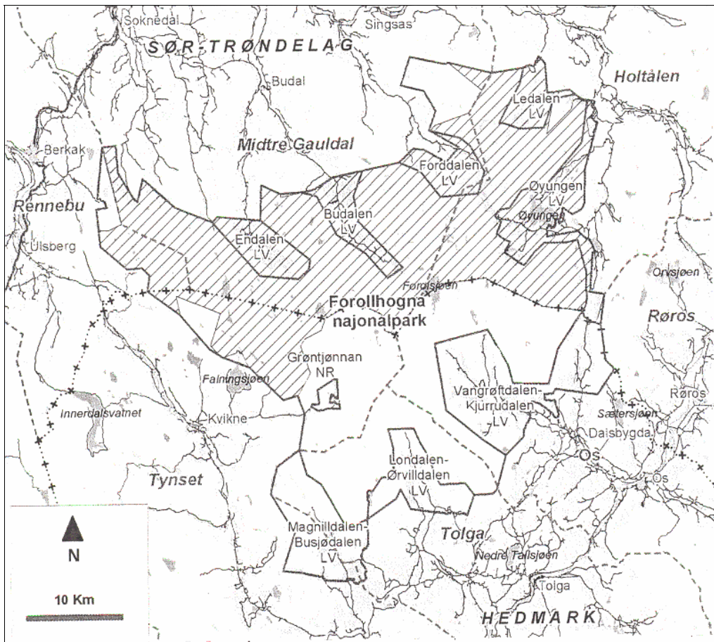
Figur 1.1: Verneområdene i Forollhogna. Lokalisering og eiendomsstruktur. Skravert område er statsallmenning.

Eiendomsforholdene i verneområdene varierer mellom Hedmark og Sør-Trøndelag. I Sør-Trøndelag dominerer statsallmenning både nasjonalparken og landskapsvernområdene, mens i Hedmark er områdene hovedsakelig i privat eie, bortsett fra en del i Tynset kommune (se figur 1.1).