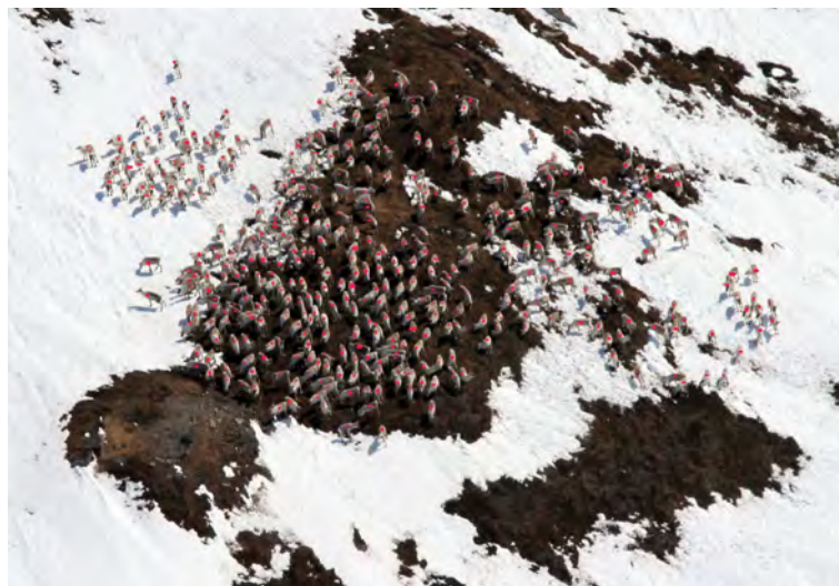
Fostringsflokken på 414 dyr i Sverjesjøhøa mandag 4. april 2011.