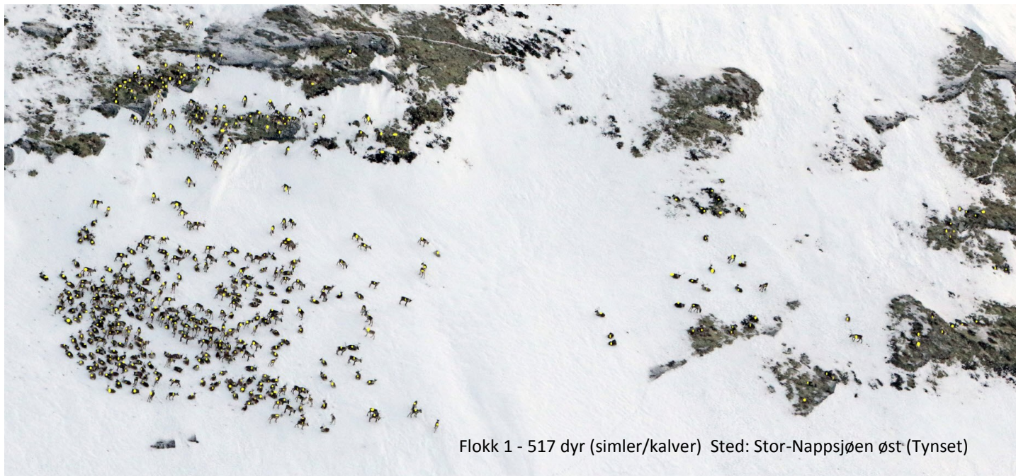
Flokk 1 - 517 dyr (simler/kalver) Sted: Stor-Nappsjøen øst (Tynset)